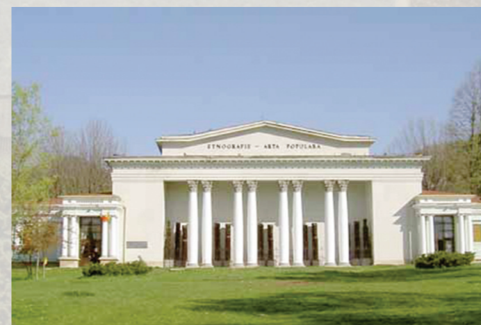
Muzeul Județean de Etnografie și Artă Populară