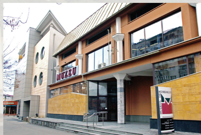
Muzeul Județean de Mineralogie „Victor Gorduza” Baia Mare