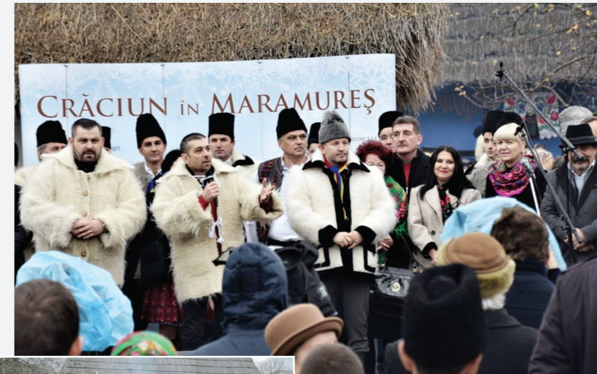
„Crăciun în Maramureș”

Ceremonia de decernare a titlului onorific a avut loc în municipiul Sighetu Marmației, orașul de baștină al maramureșeanului care a obținut, în anul 1986, Premiul Nobel pentru Pace.