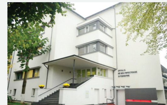
Spitalul de Boli Infecțioase și Psihiatrie Baia Mare

Doar în primele șase luni ale anului în curs, Consiliul Județean Maramureș a investit peste 4,5 milioane de lei în infrastructura medicală, și alte câteva milioane de lei în materiale sanitare și de protecție.