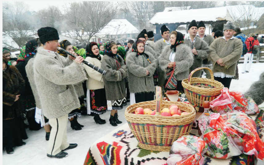
„Crăciun în Maramureș”

Scopul principal al acestui eveniment îl constituie angrenarea autorităților publice locale și instituțiilor de