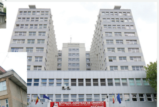
Spitalul Județean de Urgență „Dr. Constantin Opriș” Baia Mare