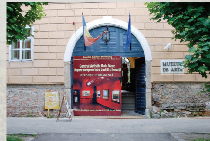
Muzeul de Artă Baia Mare