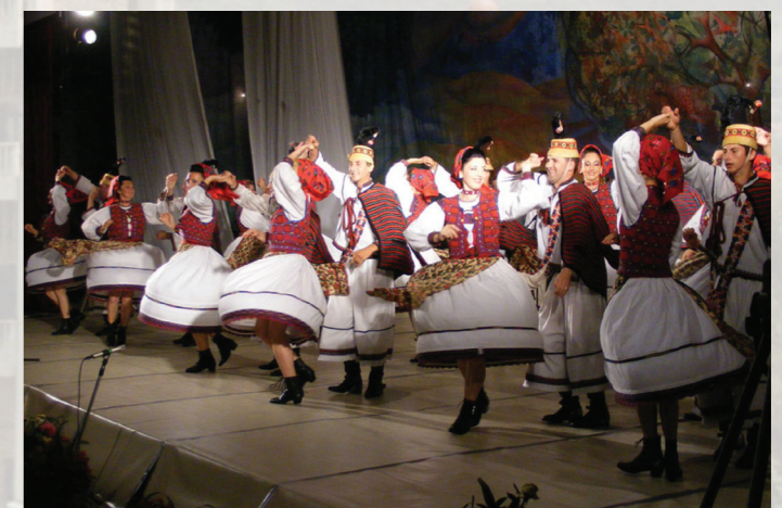
Ansamblul Folcloric Național „Transilvania”