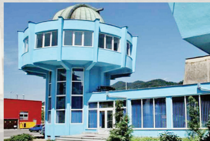
Complexul Astronomic Baia Mare