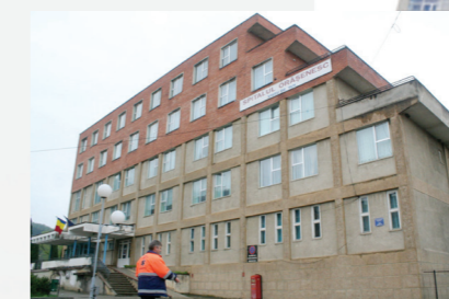
Spitalul Orășenesc Vișeu de Sus