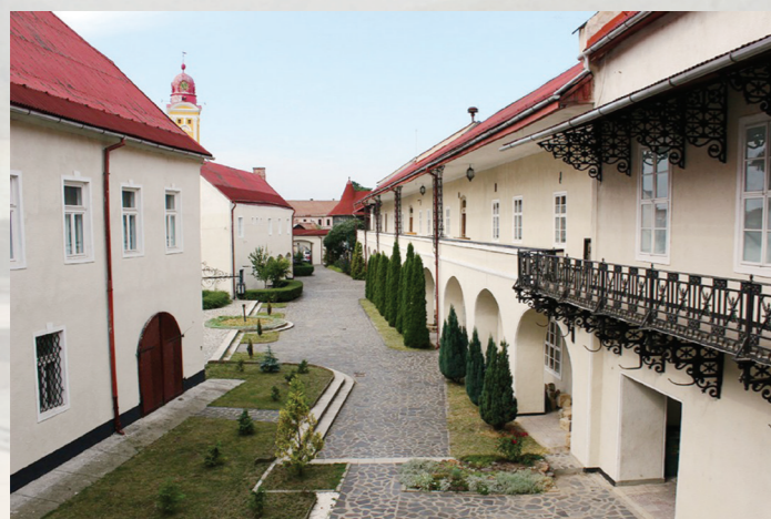
Muzeul Județean de Istorie și Arheologie Maramureș