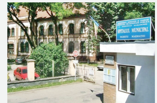
Spitalul Municipal Sighetu Marmației