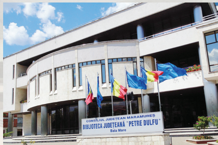
Biblioteca Județeană „Petre Dulfu” Baia Mare

Un Maramureș care respiră onoare, curaj, patriotism, hărnicie, sacrificiu. Un Maramureș de care putem fi mândri și pe care Consiliul Județean Maramureș încearcă să-l promoveze cu fiecare ocazie și oportunitate. Cred cu tărie că noi, maramureșenii, nu împărțim doar un areal geografic. Ci, mai presus de toate, împărțim aceleași credințe și idealuri. Și noi știm, asemeni meșterilor, că nu poți realiza o construcție rezistentă, fără o