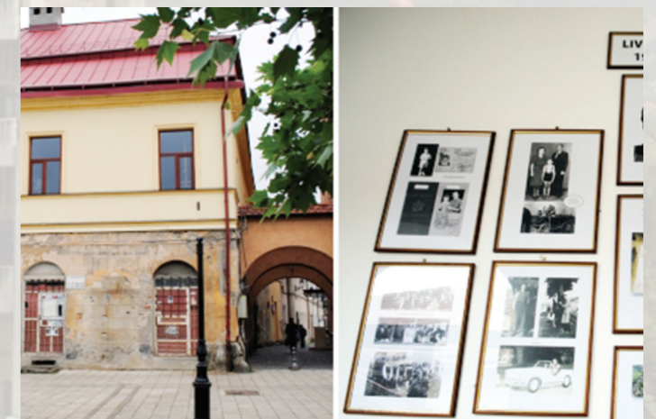
Școala de Artă „Liviu Borlan”