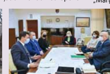
17 martie. Întâlnire de lucru cu reprezentanți ai Ministerului Mediului pentru eficientizarea Sistemului de Management al Deșeurilor în Maramureș