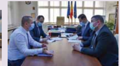
29 decembrie 2020. S-a semnat acordul de asociere între CJ Maramureș și Primăria Sighetu Marmației în vederea realizării Variantei Ocolitoare Sighetu Marmației