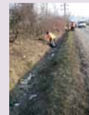
9 martie. A fost demarată procedura de curățenie a drumurilor județene