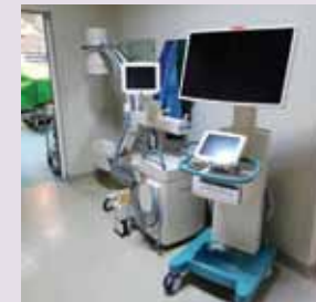
20 noiembrie 2020. Spitalul Județean de Urgență „Dr. Constantin Opreș”, dotat cu aparatură medicală performantă