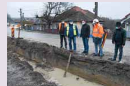
20 noiembrie 2020. Verificări pe drumurile județene cuprinse în lotul I pe Drumul Nordului