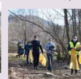
26 martie. Conducerea Consiliului Județean a participat la acțiunea de ecologizare de pe lacul Firiza