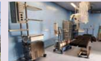
9 decembrie 2020. Dotări importante la Spitalul Județean de Urgență „Dr. Constantin Opreș” Baia Mare