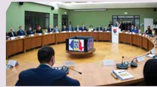
25 octombrie 2020. Ceremonia de constituire a noului Consiliu Județean