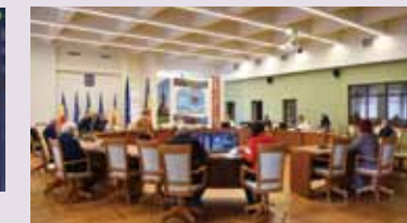
26 februarie 2021. Parteneriat între CJ Maramureș și Spitalul Județean pentru realizarea unui spital modular, finanțat din fonduri europene