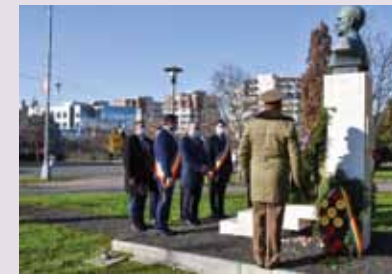
1 decembrie 2020. Depuneri de coroane la Monumentul Ostașului Român de 1 Decembrie