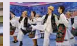
8 martie. Ansamblul Folcloric Național Transilvania în parteneriat cu CJ Maramureș organizează evenimentul online „Mărțișor folcloric”