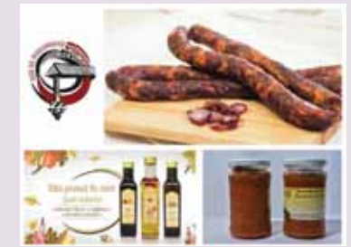
23 noiembrie 2020. 31 de produse, primele licențiate cu marca „Bun de Maramureș”