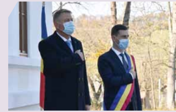
6 noiembrie 2020. Redeschiderea Casei memoriale „George Pop de Băsești”, în prezența Președintelui României