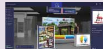
18 februarie. Județul Maramureș, promovat în cadrul primei ediții virtuale a Târgului de Turism al României